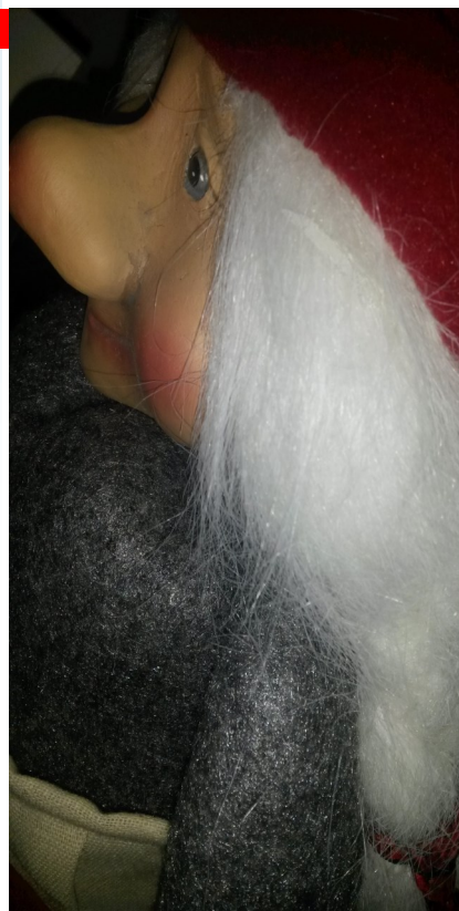
Foto Elinor Sundén, bilden på nejlikanorna och kitten är hämtad från en "fri" bildbank.