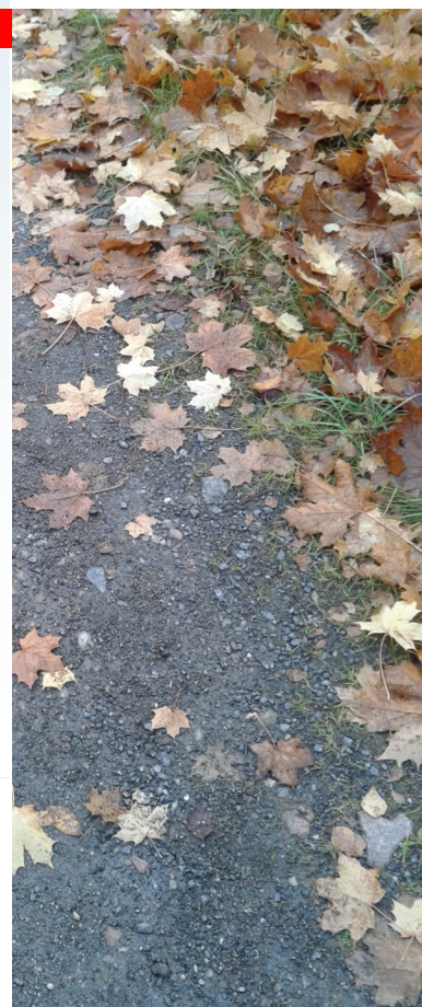
Foto Elinor Sundén utom fotot på Nicklas Franzén - foto privat, samt bilden på nejlikan som är hämtad från en bildbank.

Vid frågor: sormland@vansterpartiet.se .